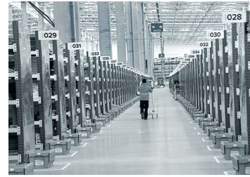
Los desafíos de la empresa tras los grandes proyectos logísticos de Walmart y Mercado Libre