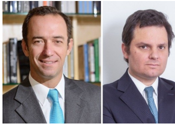
Russi & Eguiguren anuncia fusión con boutique tributaria