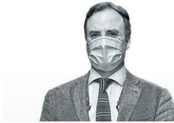
Las credenciales del nuevo presidente del Tribunal Constitucional y su rol tras el fin de la era Brahm