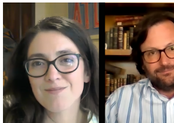
Cuestionamientos a legitimidad de la actual