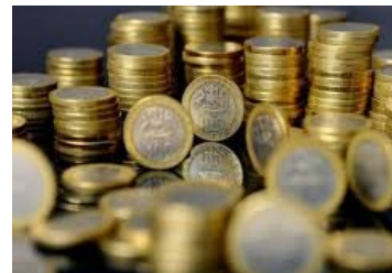
Noviembre será el mes clave para el futuro del