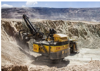
Minera de los Luksic reporta caída de producción en